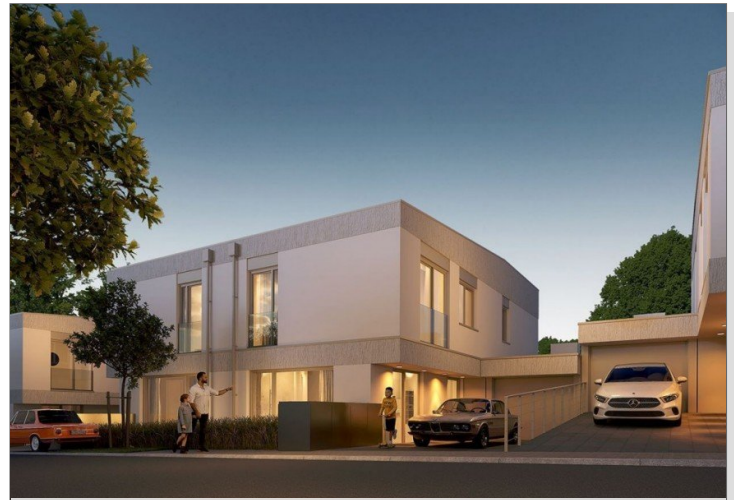
Straßenansicht bei Nacht