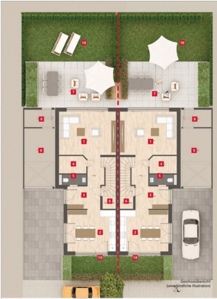
Geschossübersicht (unverpändliche Illustration)