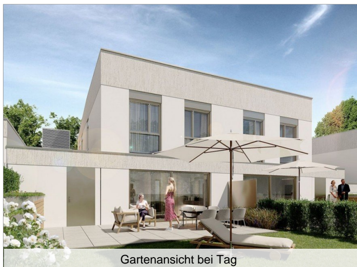
Gartenansicht bei Tag