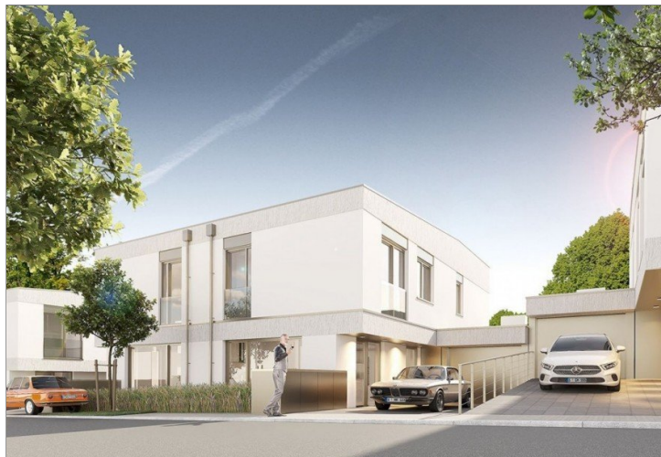
Straßenansicht bei Tag