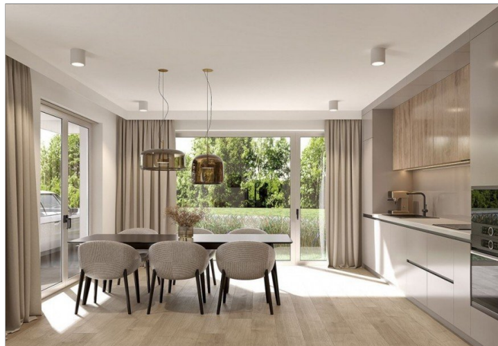
Moderne Küche mit Essbereich