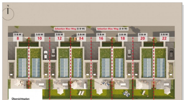
Moderne Doppelhäuser Nürtingen

"Das neue vis-à-vis" im Sebastian-Blau-Weg innerhalb des Neubaugebietes "Innerer Gänslegrund".