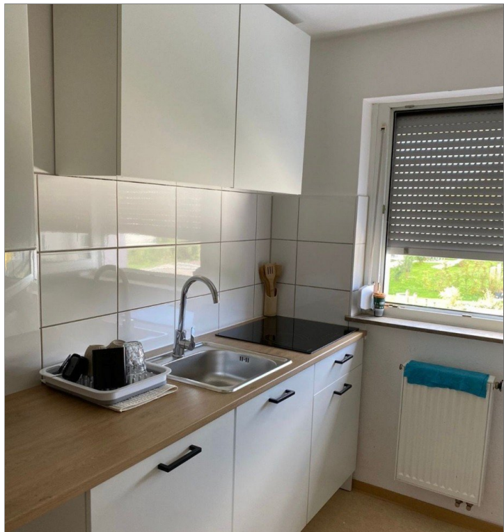
Küche vom Vormieter