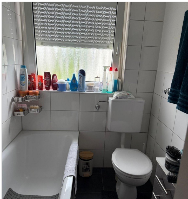
Kleines Badezimmer mit Wanne