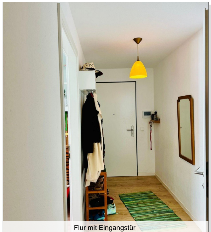
Flur mit Eingangstür