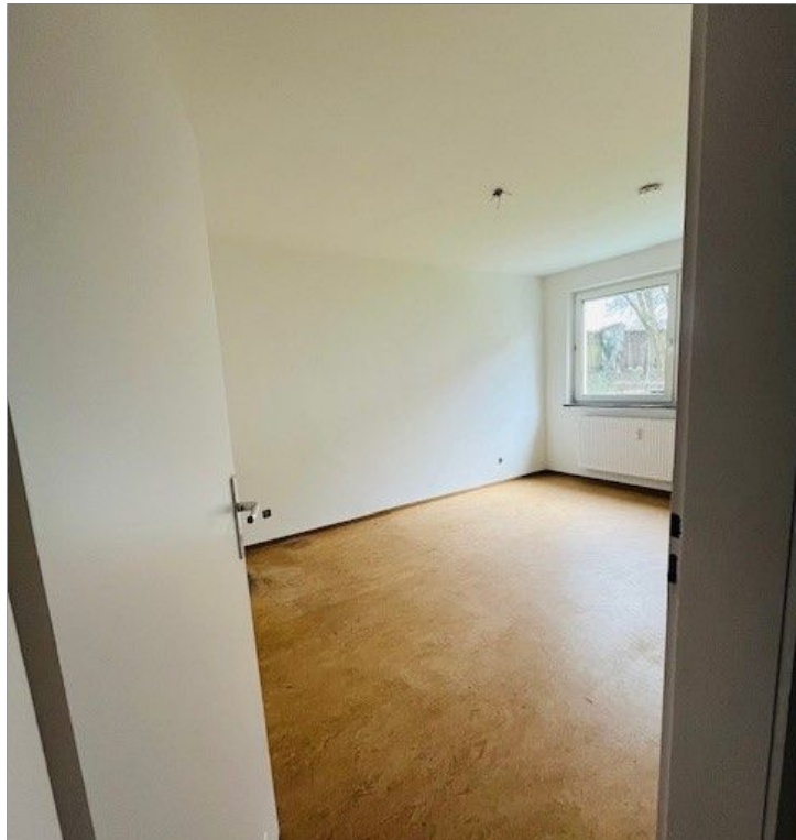
Schlafzimmer / Wohnzimmer