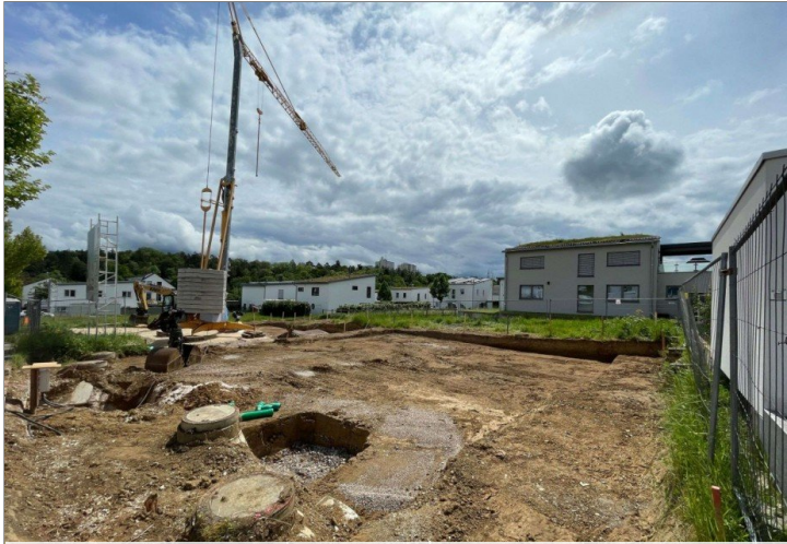
Baustellenbild vom 15.05.jpg