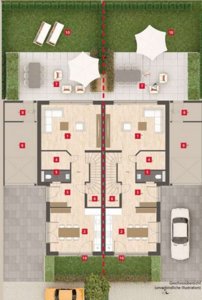
Geschossübersicht (unverpändliche Illustration)