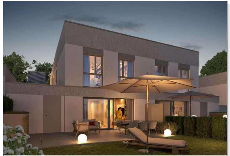
Gartenansicht bei Nacht.jpg