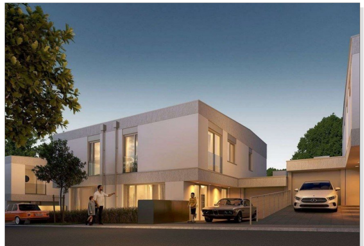
Straßenansicht bei Nacht.jpg