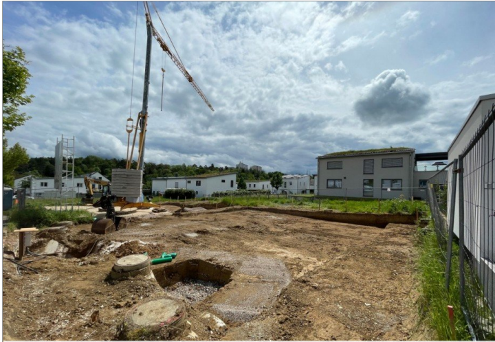
Baustellenbild vom 15.05.2026